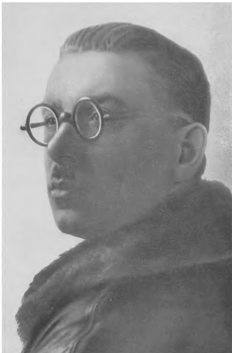
3. Илья Сельвинский после возвращения из Парижа. 1935 г. Москва.