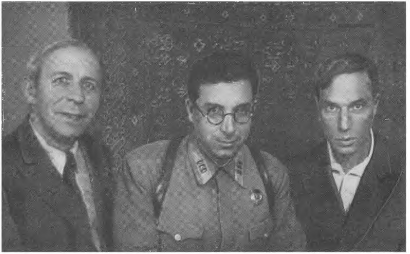
4. Н. Ассев, И. Сельвинский, Б. Пастерпак. 1942 г. Чистополь.